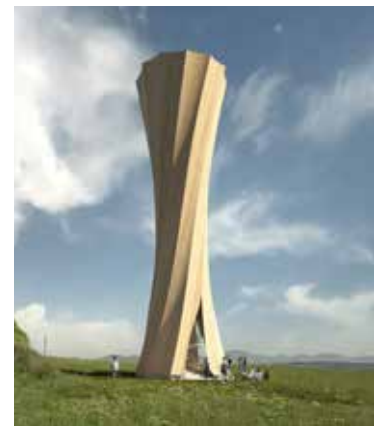
Visualisierung des Wangen Turm.