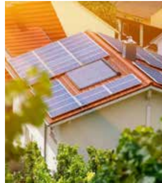
Sonnenenergie für autarkes Haus.

Schramberg / Region. Hohe Energiepreise, Unsicherheiten bei der Gasversorgung, nicht zuletzt der Klimawandel – es gibt viele gute Gründe, in Sachen Energieversorgung eigenständiger zu werden. Was kann