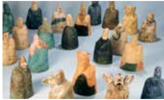
70 Gemälde, Zeichnungen und Plastiken umfasst die Kunstsammlung der Stadt Schramberg, die nun erstmals komplett im Stadtmuseum in Schloss bis zum 20. Oktober 2024 zu sehen ist.

Schramberg (mm). Erstmals komplett im Stadtmuseum im Schloss zu sehen ist die Kunstsammlung der Großen Kreisstadt Schramberg. Die Werke wurden aus den inzwischen 130 Ausstellungen ausgewählt, die der Verein „Podium Kunst e. V.“ seit seinem Bestehen organisiert hat. Es handelt sich dabei um einen Bestand von fast 70 Gemälden,