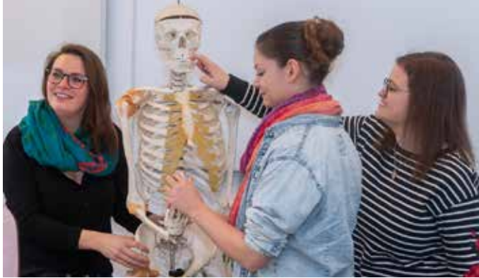
Die Beruflichen Schulen Schramberg bieten mehrere Bildungsangebote, um einen wichtigen Grundstein für die berufliche Karriere zu legen.

Schramberg / Landkreis (mm). Für Schülerinnen und Schüler mit mittlerem Bildungsabschluss, die sich höhere schulische Ziele setzen, bieten die Beruflichen Schulen Schramberg attraktive Bildungswege an. Egal ob der Wunsch ein Studium an einer Fachhochschule, ein duales Studium oder die Allgemeine Hochschulreife ist, es gibt dazu die folgend passenden Angebote. Das Berufskolleg (BK) eröffnet gleich zwei Möglichkeiten, um die Fachhochschulreife zu erreichen, über das zweijährige Berufskolleg (Bildungsangebot richtet sich an Absolventen der Mittleren Reife, die in zwei Jahren die allgemeine Fachhochschulreife erlangen möchten) und das einjährige Berufskolleg Fachhochschulreife (BKFH). Wer bereits eine abgeschlossene Be-