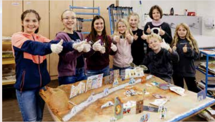
Schüler der Grundschule Tennenbronn vor einer der gefertigten Papier-Weihnachtskrippen. Die entstandenen Exponate beim Krippenbauprojekt sind in der diesjährigen Krippen-Sonderausstellung „Jesses Maria“ des Stadtmuseums Schramberg zu sehen.