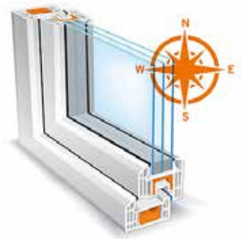
Die CE-Kennzeichnung für Fenster ist verpflichtend. Deshalb sollten Bauherren auf die Gütesiegel und Zertifizierungen der Produkte achten.