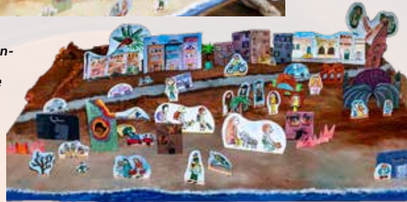
Die beim Krippenbauprojekt der Grundschule Tennenbronn unter dem Eindruck des „Gaza-Krieges“ erstellte Papierkrippe „Weihnachten in Betlehem 2024“.