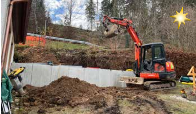
Die Bauarbeiten auf dem Oberen Friedhof Tennenbronn zur Erstellung einer Urnenwand wurden dieser Tage gestartet.

Schramberg-Tennenbronn (mm). Der Obere Friedhof im Schramberger Stadtteil Tennenbronn bekommt eine neue Urnenwand mit 24 Urnenplätzen. Die Firma Schäfer Gartenbau (Schönbronn) hat kürzlich mit den Arbeiten begonnen. Das Landschaftsarchitekturbüro arbol